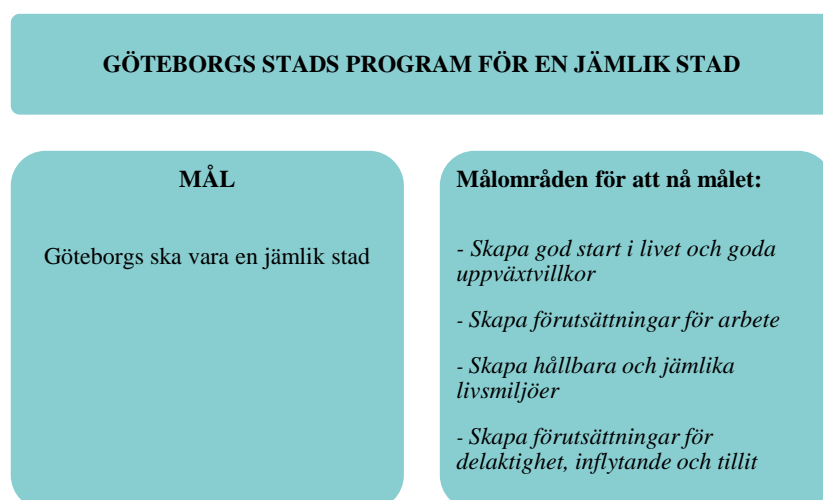
Figur 2 Programmets övergripande struktur

Detta program inleds med en beskrivning av målet med Göteborgs Stads jämlikhetsarbete. Därefter beskrivs var och ett av de fyra målområdena som stadens jämlikhetsarbete kommer fokusera på för att uppnå målet. Efter beskrivningen av varje målområde följer strategier som är av betydelse för arbetet. Varje målområde har mellan fem och sju strategier som anger fokus för arbetet.